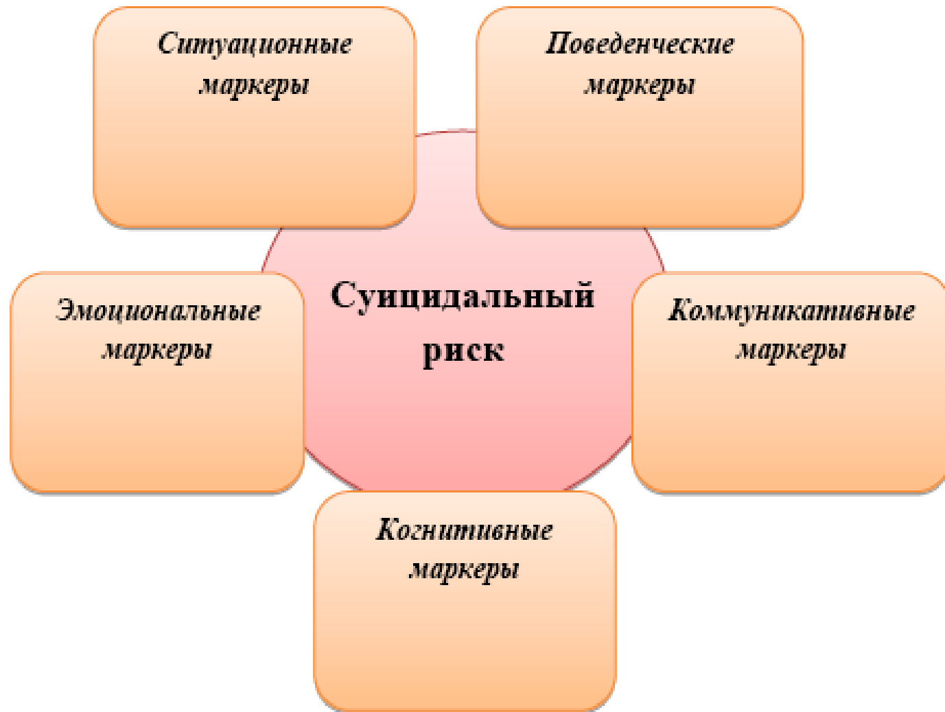
Схема 1.4.5.2. Маркеры высокого риска истинного суицидального поведения